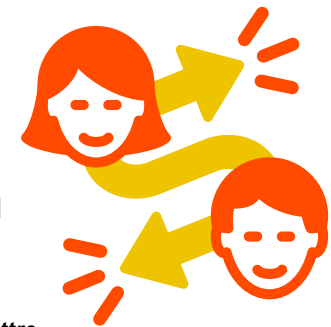
Figure de proue de la politique RSE des enseignes de textile, le recyclage n'est pas toujours facile à mettre en place... d'où l'utilité de faire appel à un acteur tiers...